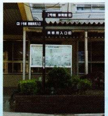
創立70周年記念校内案内看板